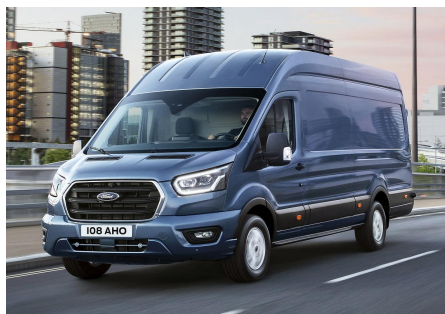
Masiniile din imagine sunt cu titlu de prezentare