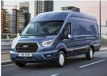
Masiniile din imagine sunt cu titlu de prezentare