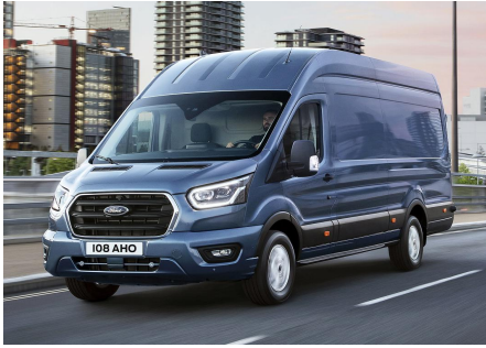
Masiniile din imagine sunt cu titlu de prezentare